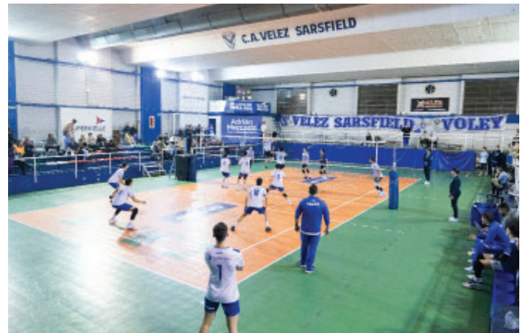
Vóley en el Estadio Ana Petracca.